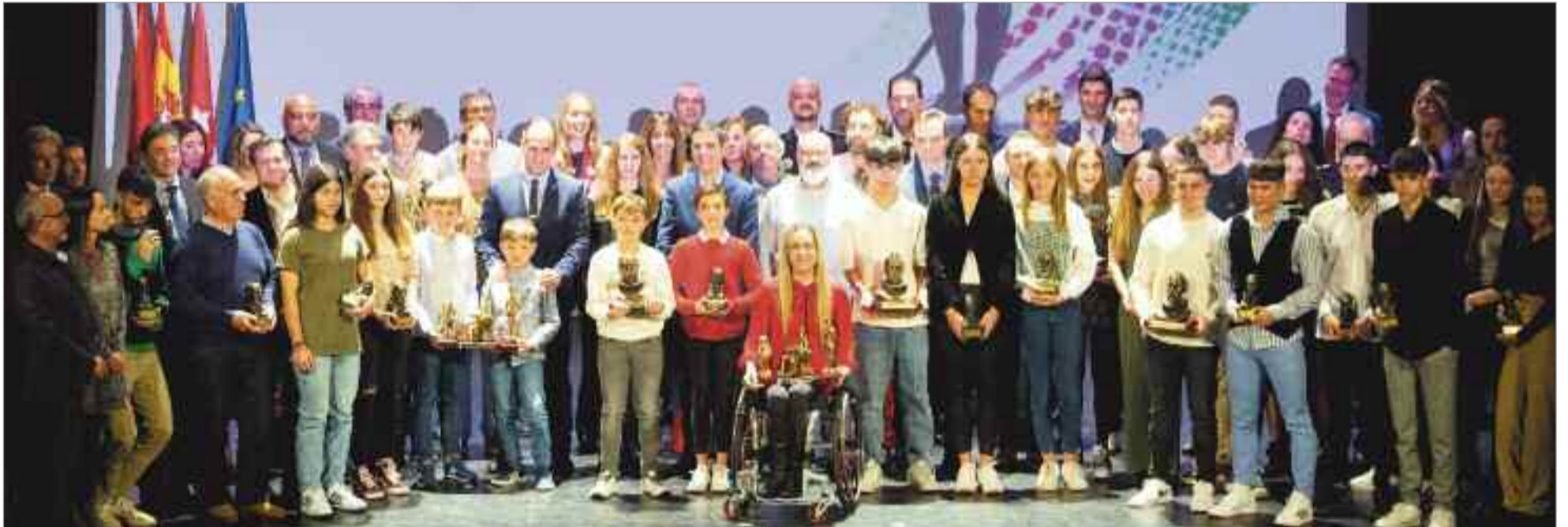
El Teatro Salón Cervantes se vistió con sus mejores galas para albergar, un año más, la ceremonia de entrega de los Premios Cervantes al Deporte 2022, unos galardones que reconocen a los mejores deportistas de la ciudad

Alcalá de Henares reconoció a los mejores deportistas sub-12, sub-14, sub-16, sub-18, absoluto y veterano en categorías masculina y femenina; con galardones especiales en categorías honorífico ex aequo, mejor entidad colaboradora y a los valores tanto a nivel local, como regional y nacional