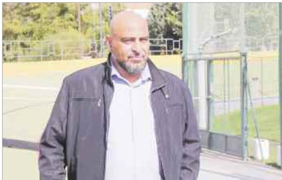
Ciudadanos instó al Gobierno de Ayuso a que incremente la partida presupuestaria destinada a Deporte

“En Alcalá de Henares todavía arrastramos las consecuencias de la pésima gestión del Partido Popular en materia deportiva durante el mandato de Bartolomé González y no podemos consentir que, ahora también, la dejadez de