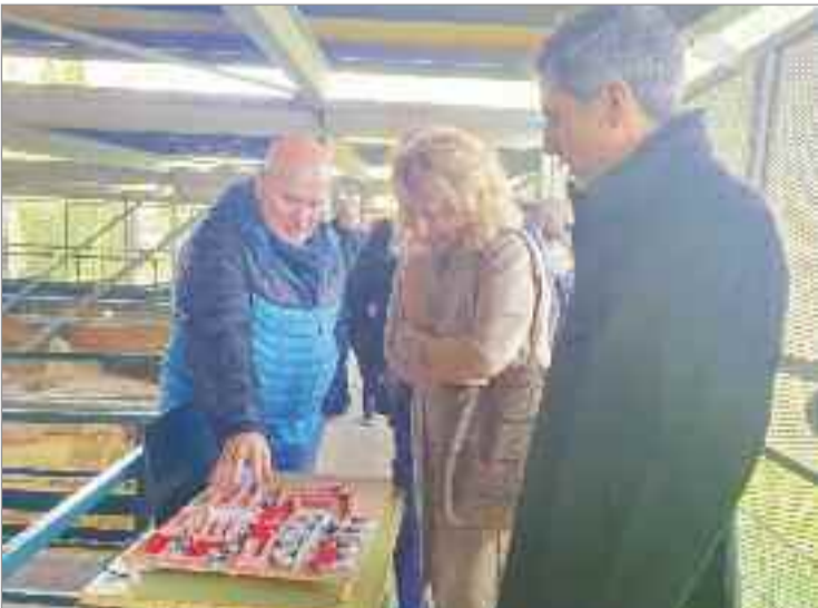
El yacimiento de Complutum es uno de los más importantes del mundo

En el acto, que se celebró en la Casa de Hippolytus, también participaron representantes de la Dirección de Área Territorial Madrid Este de Educación, otros ediles de la Corporación Municipal y miembros de la Comunidad Educativa del IES.