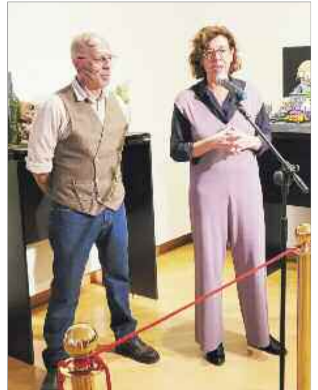
La teniente de alcalde y concejala de Cultura inauguró de la exposición "QUÉ POP! SOY?"

https://www.youtube.com/@POPCultureSpain .