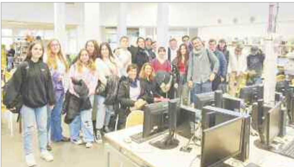
La actividad permite cumplir el objetivo de la integración de las personas con discapacidad en todas las facetas

Dos de ellas son personas con discapacidad, motórica en un caso y visual en otro, y las otras tres son compañeras que habitualmente las ayudan en la vida cotidiana del instituto; todas intercambiaron experiencias con otros alumnos en situación similar del centro educativo francés. Las alumnas fueron acompañadas