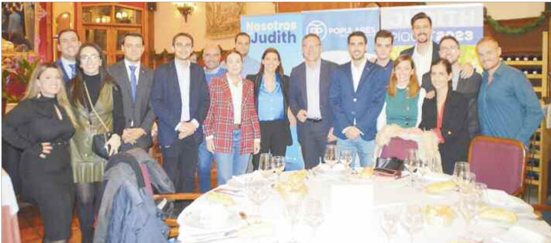
A la cena de Navidad de los Populares Complutenses asistieron varios miembros del Gobierno de la Comunidad de Madrid