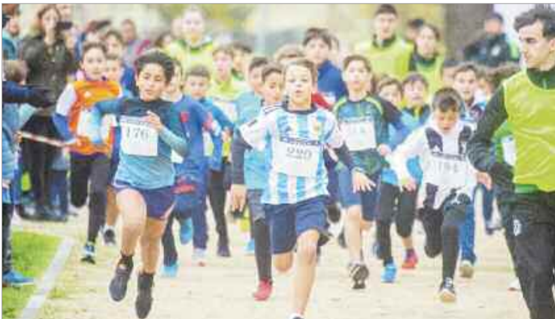
Cientos de pequeños deportistas disfrutaron de una mañana de domingo muy propicia para el deporte en Alcalá de Henares