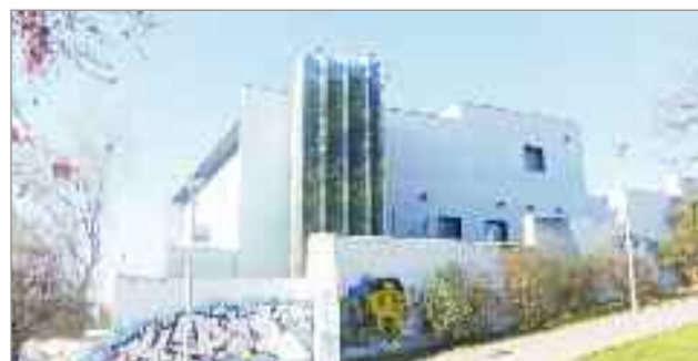
El Centro Gilitos fue el escenario de la actuación de Josetxu obregón

El reconocido violonchelista Josetxu Obregón llegó, al Centro Sociocultural Gilitos de Alcalá de Henares, para presentar su último trabajo, "Celloevolution", con el que el artista vasco, uno de los más destacados de la escena de música antigua internacional, hace un viaje musical sobre la evolución del instrumento. El violonchelo de Josetxu Obregón recorrió la historia de este instrumento, desde su aparición en el barroco hasta que Bach creó sus seis maravillosas suites. Un espectáculo imprescindible para los amantes de la música antigua.