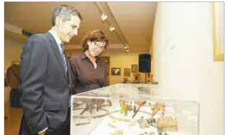
La exposición está compuesta por una colección de diferentes juguetes antiguos de la familia complutense Gamo Campos