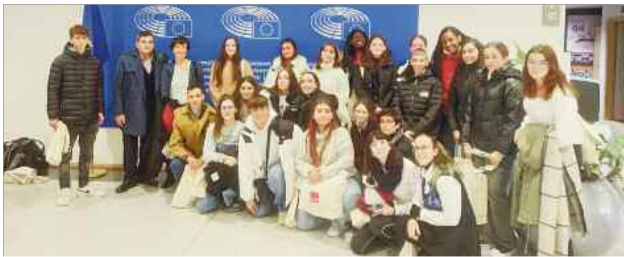
El grupo de alumnos del centro alcalaíno visitó los diferentes edificios del Parlamento y mantuvieron una charla debate con la eurodiputada.

Se trata de un proyecto impulsado por el Parlamento Europeo para la difusión de los valores de la Unión Europea entre sus estudiantes. Así, en el marco de este proyecto, 25 alumnos de primero de bachillerato y dos profesores fueron invitados, por la eurodiputada del grupo S&D, Mónica González Silvana, a visitar la sede del parlamento europeo en Bruselas. El grupo de alumnos del centro alcalaíno visitó los diferentes edificios del Parlamento y mantuvieron una charla debate con la eurodiputada. En este debate coincidieron con un grupo de alumnos y profesores del IES Alonso de Avellaneda de Alcalá de Henares, que también habían sido invitados por la eurodiputada. Además, los alumnos aprovecharon para conocer el centro histórico de la capital belga antes de regresar a Alcalá.