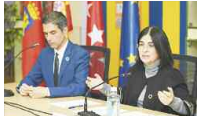
El programa, desarrollado en colegios públicos, se inicia en Alcalá de Henares y se extenderá en una primera fase a Alcorcón, A Coruña, Granada, Valladolid y Cáceres, con el objetivo de cubrir todo el territorio nacional.