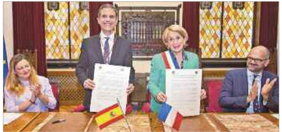
El Memorando firmado entre ambas ciudades tiene por objeto obtener una colaboración estrecha y profesional en la que prevalezcan las materias culturales y económicas

Alcalá de Henares y Montauban son dos ciudades unidas por un personaje ilustre, Manuel Azaña, que nació en la ciudad complutense y falleció en el exilio en el municipio francés. El Memorando que ambos han rubricado tiene por objeto “obtener una colaboración estrecha y profesional en la que prevalezcan las materias culturales y económicas donde se pueda dar un intercambio bilateral de las estrategias exitosas que ambos Ayuntamientos utilizan para lograr el mejor aprovechamiento de sus recursos y ofrecer a sus