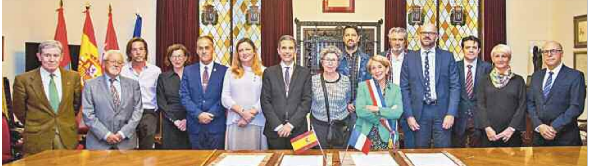
Asistieron la directora general del servicio exterior del Ministerio de Asuntos Exteriores, Unión Europea y Cooperación; el vicealcalde, la teniente de alcalde, la concejala de Turismo de Montauban, familiares de Manuel Azaña, miembros de Foro del Henares, y representación de la Asociación para la Recuperación de la Memoria Histórica de Alcalá entre otras personalidades.

Ambas ciudades están unidas por Manuel Azaña, que nació en la ciudad complutense y falleció en el exilio en el municipio francés