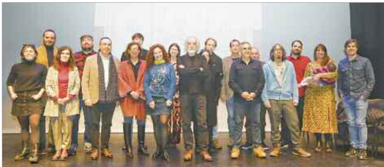
Aranguren hizo hincapié en que en los últimos meses el Teatro ha sido objeto de obras de mejora por valor de cerca de 270.000 euros

ha trabajado en 34 películas, 20 series y 24 obras teatrales) y Álex Villazán (Mejor actor revelación de la Unión de actores y Actrices por su papel en El curioso incidente del perro a medianoche, y conocido también por su trabajo en producciones como Caronte, Skam o Mientras dure la guerra). El sábado 28 de enero, más teatro, de la mano de Lantia Ecénica llega "El Peligro de las Buenas Compañías", Interpretado por actores y actrices de primer orden: Carmen Conesa (ha participado en más de 30 obras teatrales, y ha sido reconocida con un premio a la mejor actriz de televisión y mejor interpretación